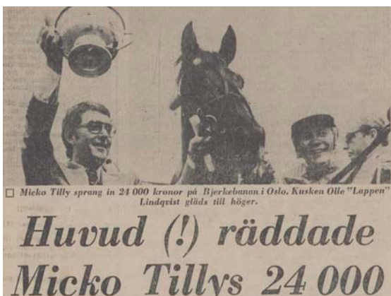
Faksimil från Dagens Nyheter.